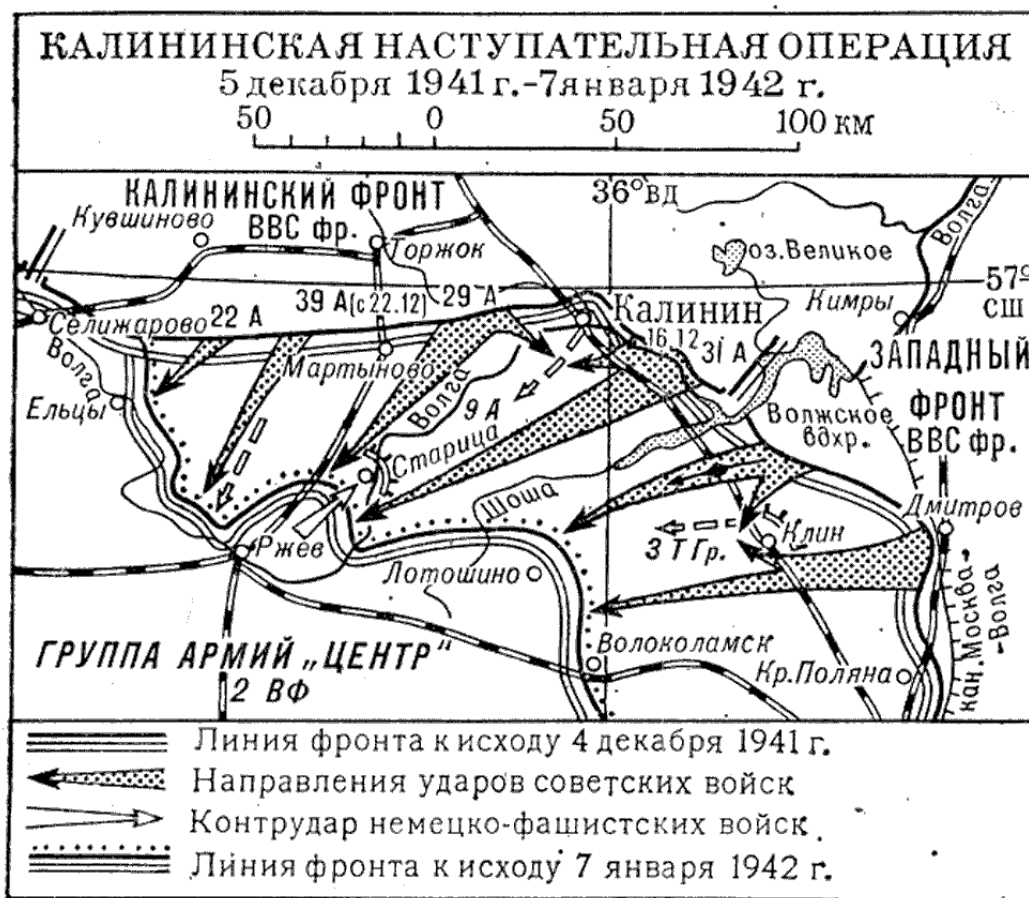
Калининская операция 1941–1942 года.

Участвовал в войне в качестве разведчика в составе отдельной мотострелковой разведывательной роты 366 стрелковой дивизии. 366-я стрелковая дивизия — воинская часть СССР в Великой Отечественной войне. Формировалась с 26 августа по 9 ноября 1941 года в Томской области. В состав дивизии вошли военнообязанные из Томской, Кемеровской, Омской областей, Красноярского и Алтайского краёв. 9 ноября 1941 года со станции Томск-2 была отправлена на фронт. Калининский фронт — оперативно-стратегическое объединение в вооружённых силах СССР во время Великой Отечественной войны.