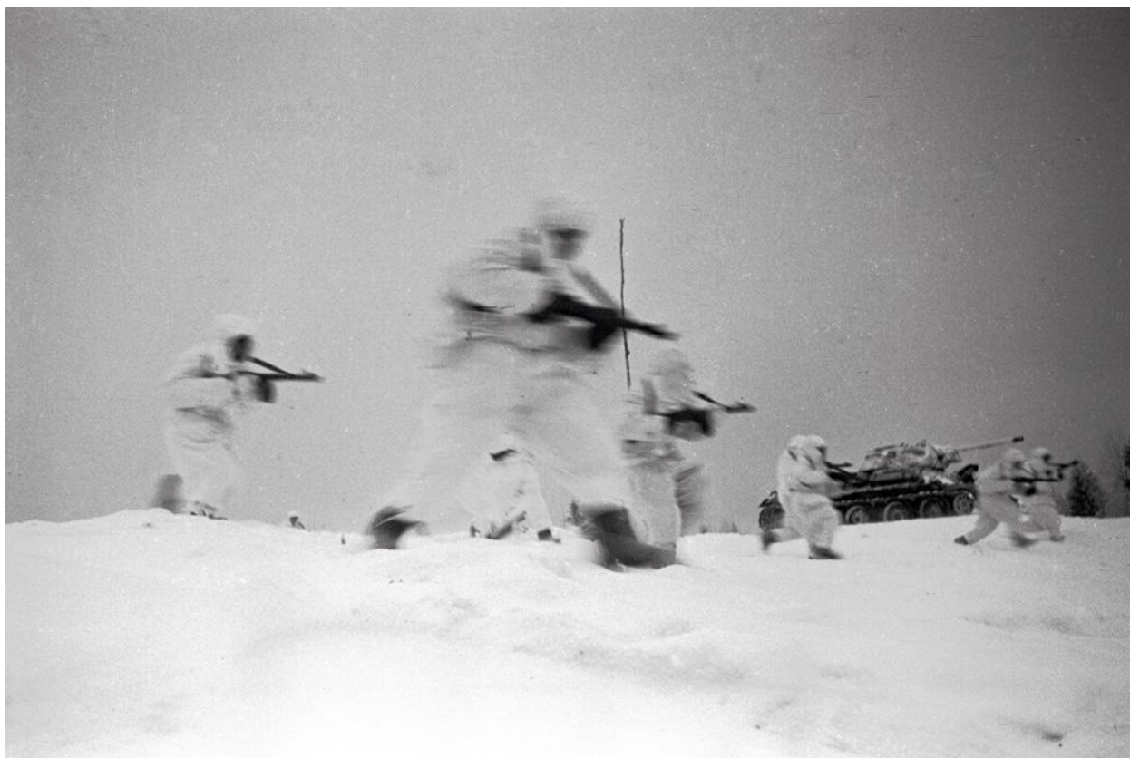
«В атаку». Автоматчики в маскхалатах бегут в атаку при поддержке танков Т-34. Бой за город Старицу. Калининский фронт, Калининская область, РСФСР, 1 февраля 1942 года.

директивы Ставки ВГК от 17 октября 1941 из части сил Западного фронта (22, 29, 30 и 31-я армии) на северо-западном направлении от Москвы, действуя против сил немецкой группы армий «Центр». Войска, на основе которых был сформирован фронт, участвовали в обороне Калинина, потеряли город, но нанесли поражение вражеской группировке, прорвавшейся от Калинина в направлении Торжка, не дав немцам развить успех. С 22 января 1942 войска правого крыла фронта участвовали в проведении Торопецко-Холмской операции. Летом—осенью—зимой 1942 года Калининский фронт участвовал в двух стратегических наступательных операциях: Первой Ржевско-Сычëвской операции (30 июля—1 октября 1942 года) и Второй Ржевско-Сычëвской операции (25 ноября—20 декабря 1942 года).